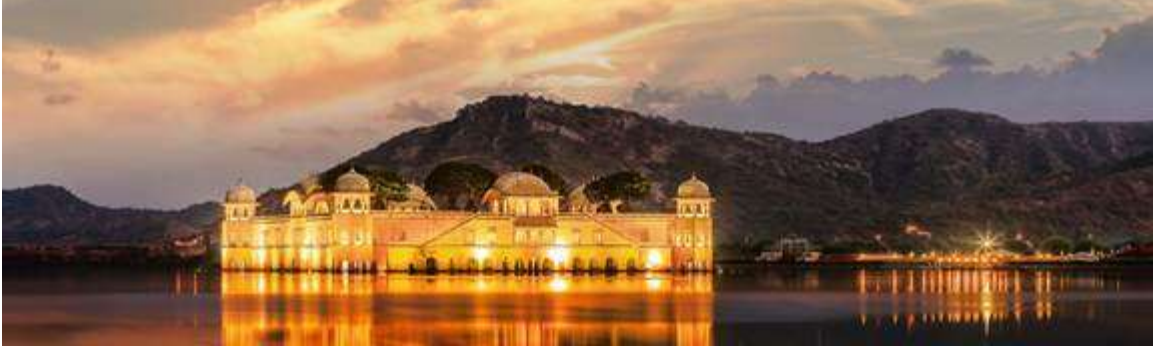
(SASCI अंतर्गत प्रकल्प) जल महाल, जयपूर